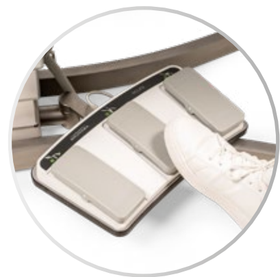
Control de pie