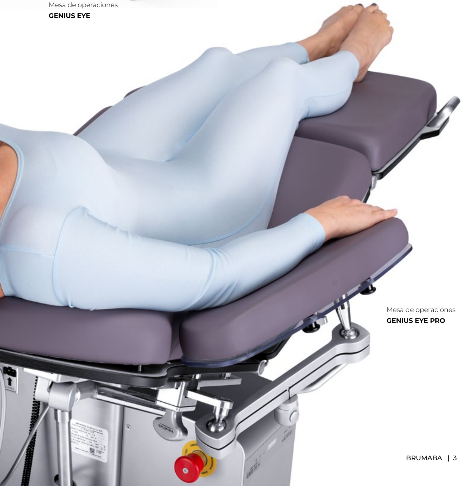
Mesa de operaciones GENIUS EYE PRO