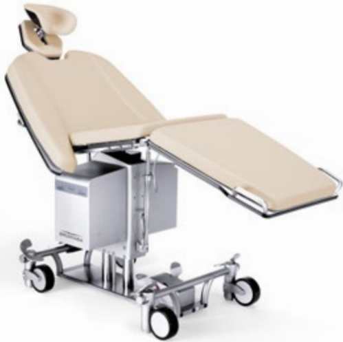
Mesa de operaciones GENIUS EYE