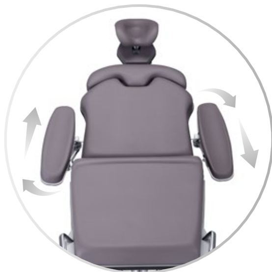
Ajuste flexible del reposabrazos