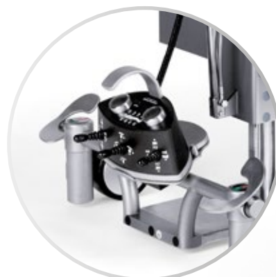
Pedal de control opcional: El cirujano puede realizar ajustes intraoperatorios sin comprometer la esterilidad.