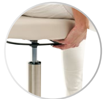
Ajuste de altura manual