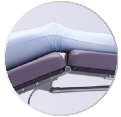
Acolchado extragrueso para máxima comodidad del paciente

Escanea el código QR para ver la GENIUS EYE PRO en acción en el video del producto!