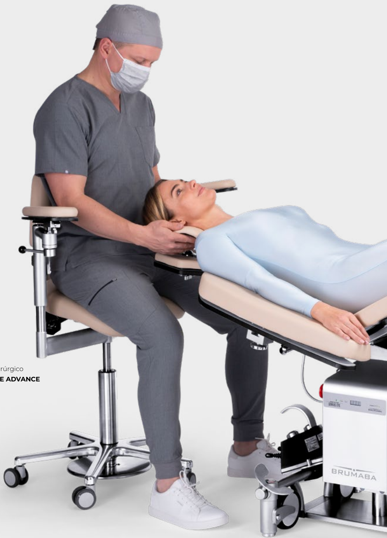
Sillón quirúrgico BALANCE ADVANCE