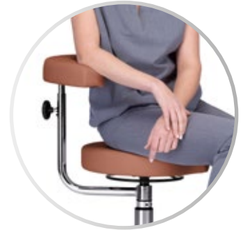
Ajuste en altura del respaldo sencillo