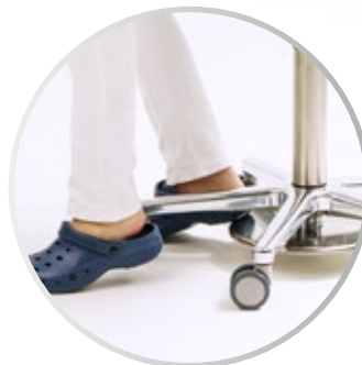
Ajuste de altura accionado por el pie, ideal para trabajar estéril