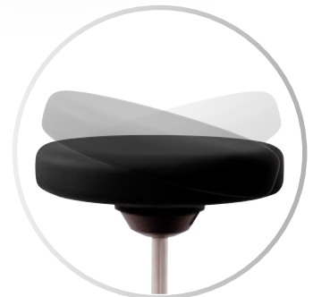
Disponibile con asiento COMFORT SWING estéril