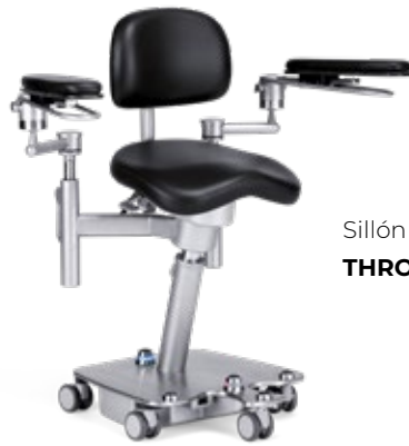
Sillón quirúrgico THRONUS T3