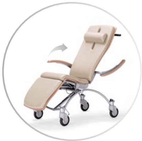
Reposabrazos ajustables automáticamente en posición reclinada (Plegables)