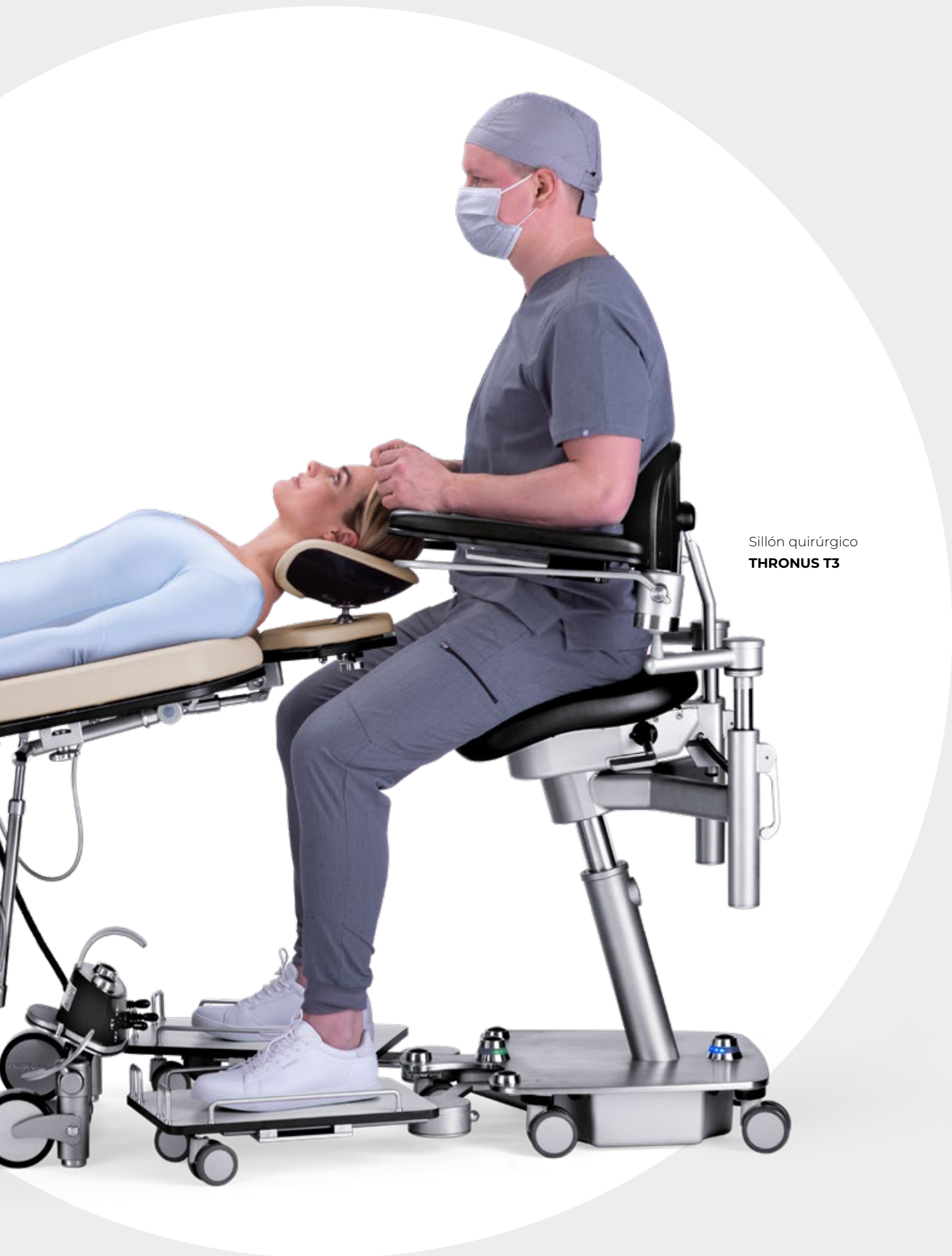
Sillón quirúrgico THRONUS T3