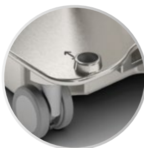
Ajuste en altura electromagnético