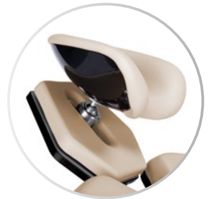
Reposacabezas regulable tridimensionalmente

Escanea el código QR para ver la GENIUS EYE en acción en el video del producto!