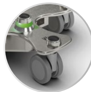
Función de memoria para programar dos alturas