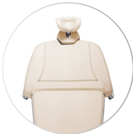
Reposabrazos integrados para facilitar el posicionamiento de los brazos