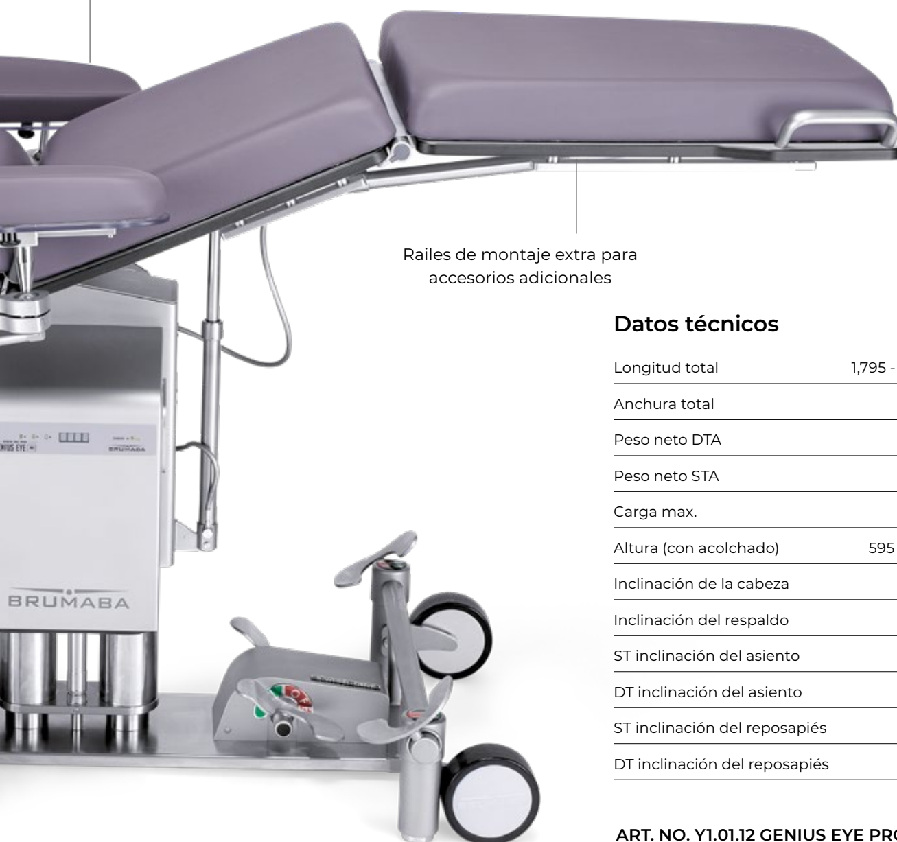
Railes de montaje extra para accesorios adicionales