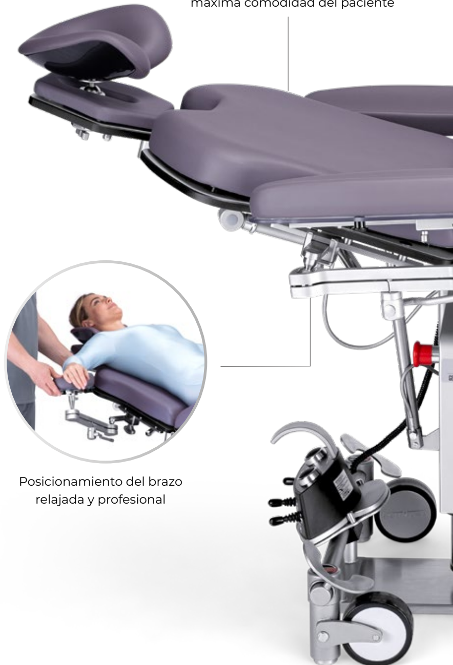
Posicionamiento del brazo relajada y profesional